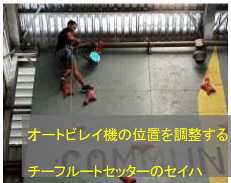
オートビレイ機の位置を調整する