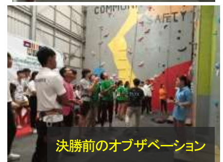
決勝前のオブザベーション