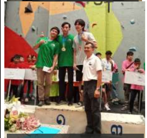
男子リード入賞者とソレリン理事長