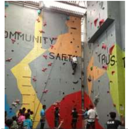
初参加の小学生を前に CCF のソレリン理事長が自らデモクライミング