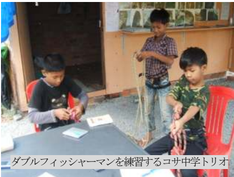
ダブルフィッシャーマンを練習するコサ中学トリオ