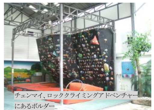
チェンマイ、ロッククライミングアドベンチャーにあるボルダー