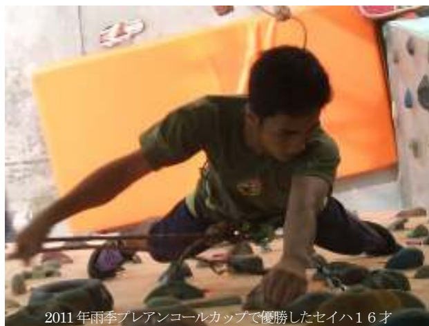
2011年雨季ブレアンコールカップで優勝したセイハ16才

※出場想定最大人数 (Workshop参加者は準備予選通過者のみ) 36名、参加賞: なし、入賞は、各クラス1位、2位、3位、総合1位 (男女別)、クラス別: 記念Tシャツ、賞状、総合: アンコールカップ (プロロンクマエ作品)