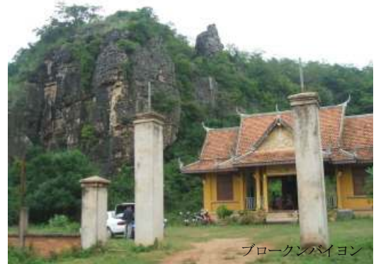
ブロークンバイヨン

シソボンよりも近く、TAXI代が安く上がる。クレーン山南山麓、PHRAH ANG CHUP 寺院の傾斜のない参道を詰める。頂上プラトー直下になると思うが、寺院の背後に10~20mのフェース、ピラーが数kmに渡って東西に続いていた。遠目にはジャングルにさえぎられて切れ切れの岩壁に見えるがスケールはシェフィールドに比肩する(?)。しかしジャングルも半端じゃない。脆い部分も多々あってボルトは一部ケミカルが必要になりそうだが、硬い部分は猛烈に硬くキリが折れたことあり。15mの壁に1ヶ所アンカーを入れて試登済み。