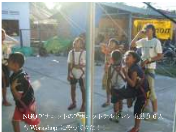
NGO アナコットのアナコットチルドレン (孤児) 6人も Workshop にやってきた!!