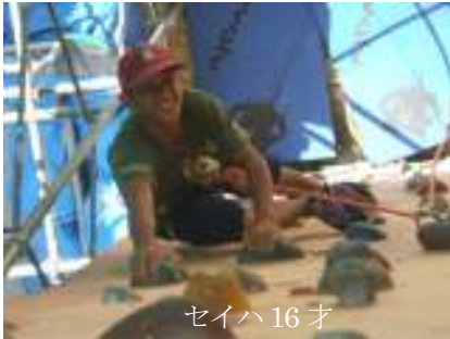
セイハ 16 才